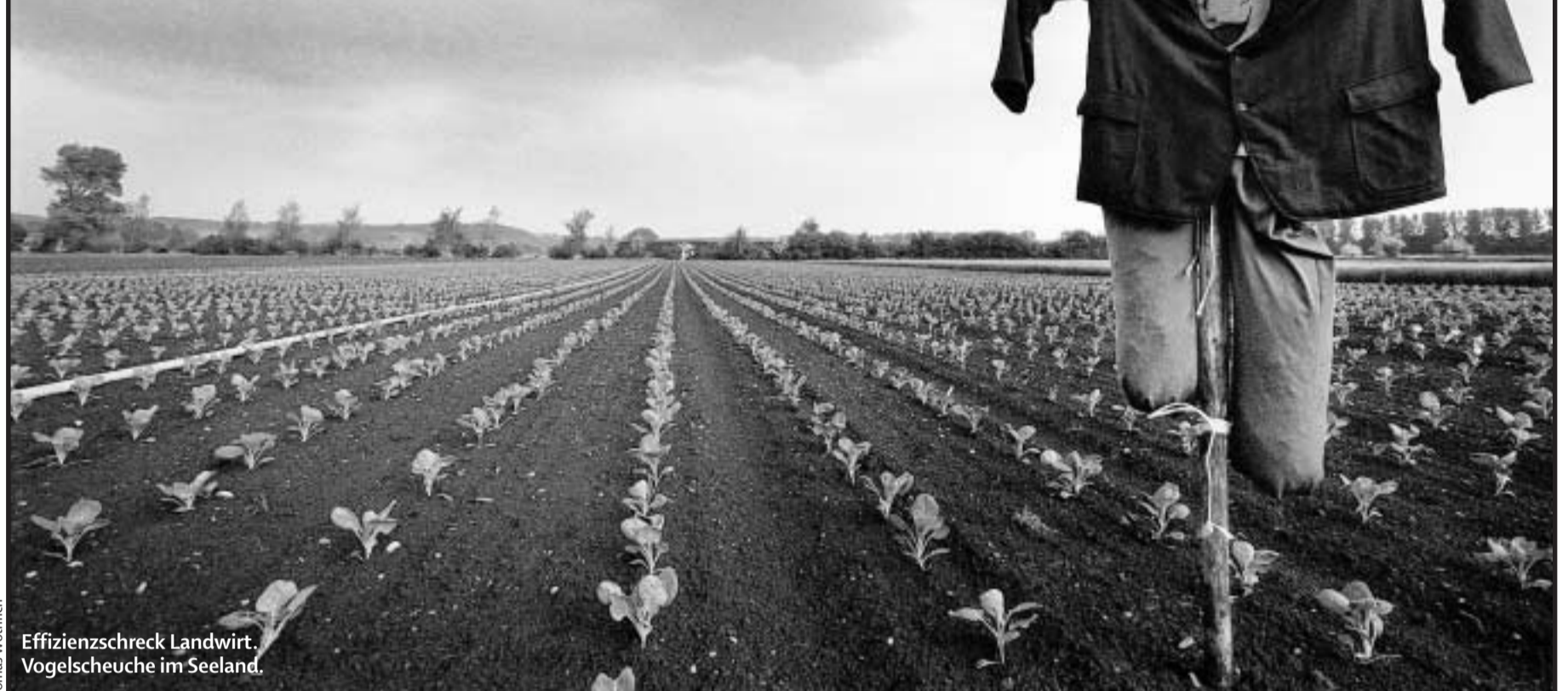
Effizienzschreck Landwirt. Vogelscheuche im Seeland.

Zehn Jahre nach Beginn der Agrarreformen steht die schweizerische Landwirtschaft unter Dauerdruck: Zu teuer, zu marktfern, zu ineffizient, zu unbeweglich. Sind die Bauern Auslaufmodelle? Nein, sagt der Agrarhistoriker Peter Moser. Wenn wir begreifen, was die Landwirtschaft wirklich vermag, hat sie Zukunft.