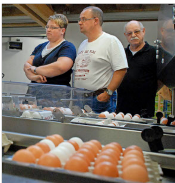
Einblicke gewähren: Das direkte Gespräch zwischen Erzeuger und Verbraucher schafft die nötige Transparenz.

Das wäre für die Landwirtschaft, wo die Erhaltung und die Nutzung der natürlichen Ressourcen im gleichen Prozess erfolgt, absolut zentral. Außerdem müsste man klar aussprechen: Man kann nicht die Billigpreise aus den Prospekten haben und gleichzeitig eine idyllische Landschaft erhalten. Beides geht einfach nicht zusammen. Erst wenn die Stimmbürger und Stimmbürgerinnen über dieses Wissen verfügen, können sie rational entscheiden, was sie wirklich wollen. Deshalb ist es so zentral, nicht nur Bilder und Zahlen zu vermitteln, sondern auch Wissen.