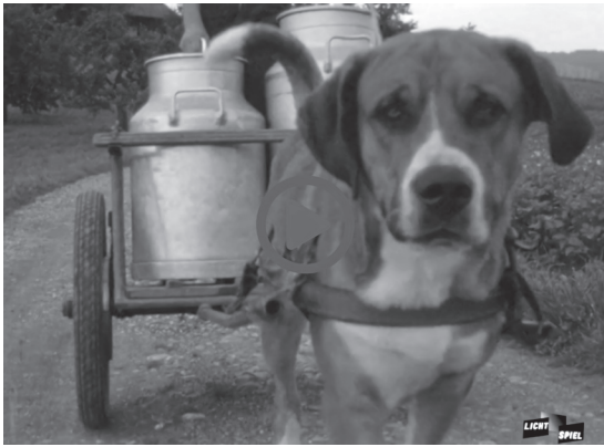
Der erste Videoessay der Serie Video Essays in Rural History thematisiert die Bedeutung von arbeitenden Pferden, Rindern, Hunden, Maultieren und Eseln in der Landwirtschaft und in den Städten des 19. und 20. Jahrhunderts. 19

und Kanada publiziert worden sind. Sie thematisieren aus einer historischen Perspektive die Bedeutung von arbeitenden Tieren, die Amerikareisen von Schweizer Agronomen und Bauern im frühen 20. Jahrhundert, die nachbarschaftliche Zusammenarbeit im ländlichen Kanada und die Motorisierung der belgischen Landwirtschaft.