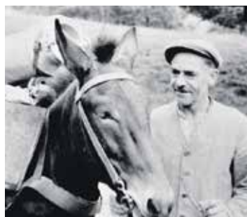
ARCHIVES DE L'HISTOIRE RURALE