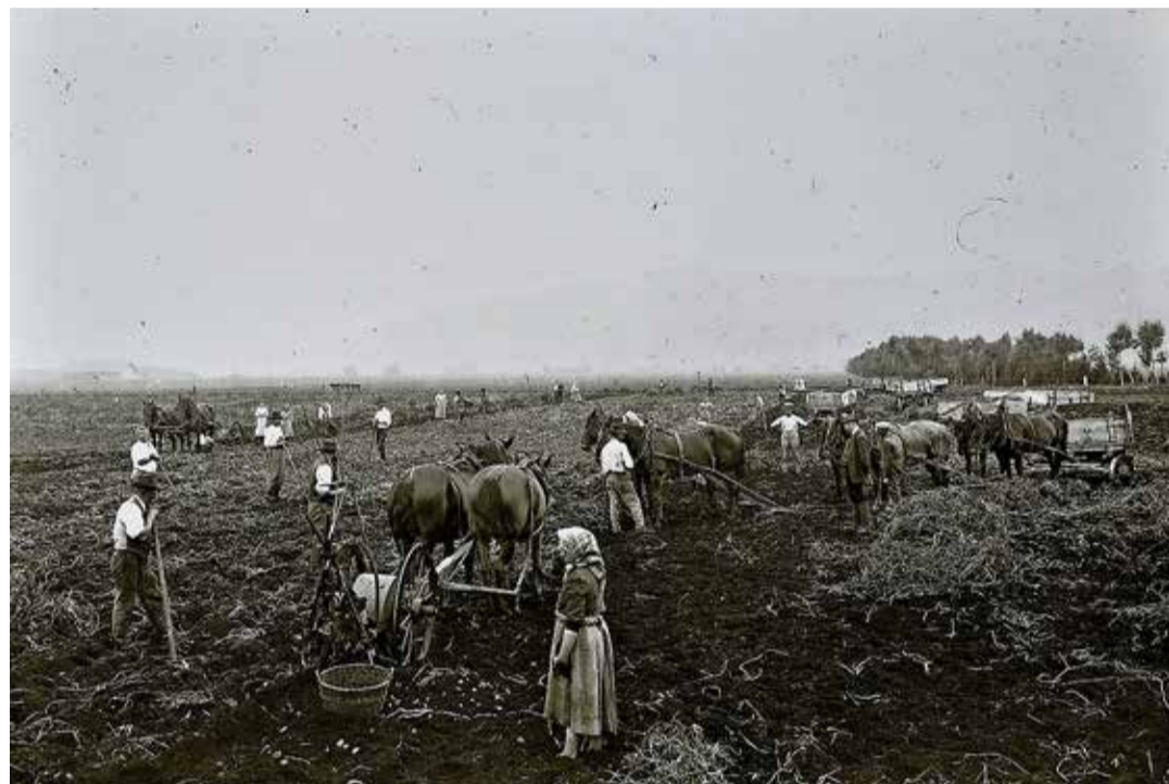
Les récoltes de pommes de terre en 1912 à Witzwil (BE).

Les animaux ont joué un rôle essentiel en zones agricoles et urbaines. Le projet des AHR veut reconstruire cette histoire en documentant la coopération entre les hommes et les animaux dans les divers