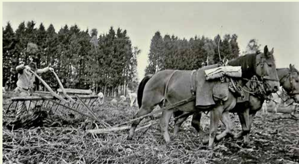
ARCHIVES DE L'HISTOIRE RURALE